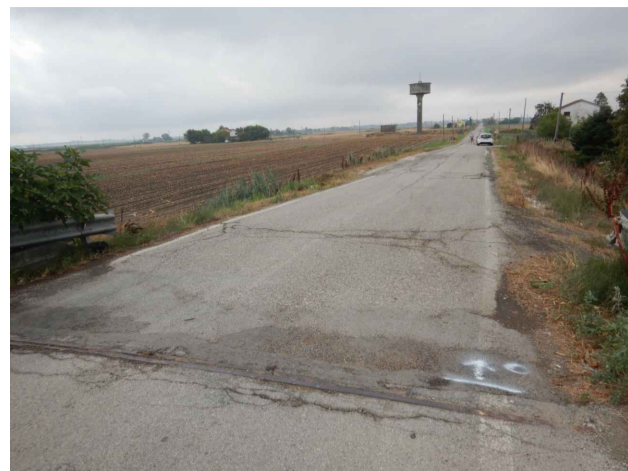
A photograph showing a white car driving away on a road with severe, longitudinal cracking in the pavement. The road is flanked by grassy areas and trees.